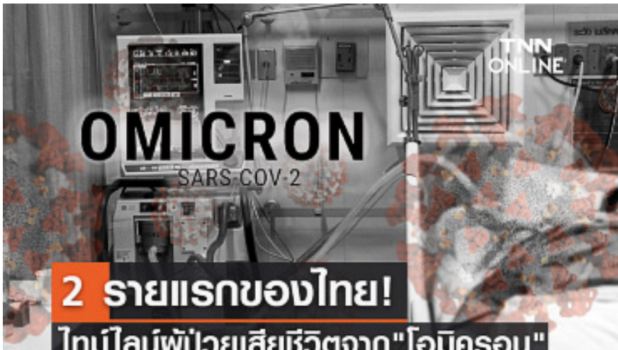
ไทยเสียชีวิตจาก“โอมิครอน”แล้ว 2 ราย เช็กไทยโอมิครอนได้ที่นี้!