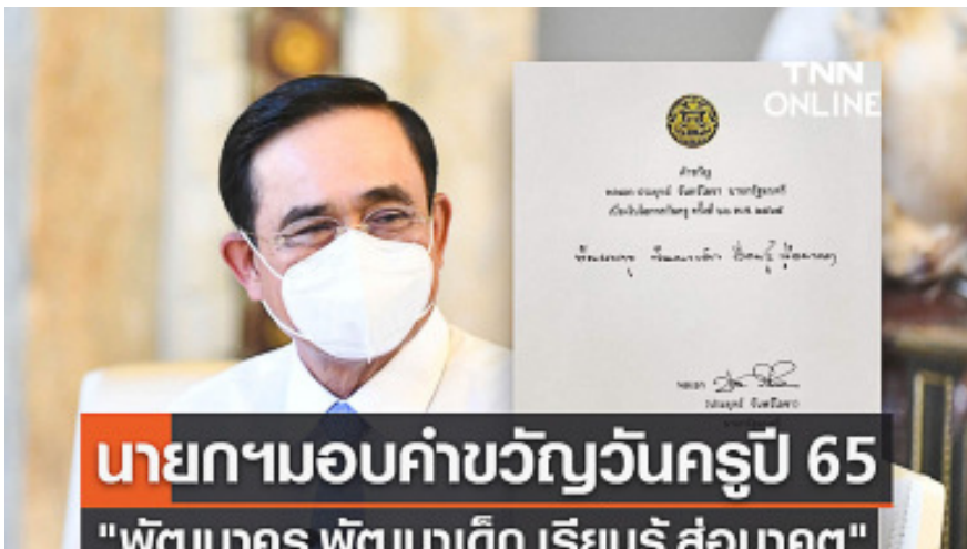
นายกฯ มอบคำขวัญวันครู ประจำปี 2565 “พัฒนาครู พัฒนาเด็ก เรียนรู้ สู่นาคต”