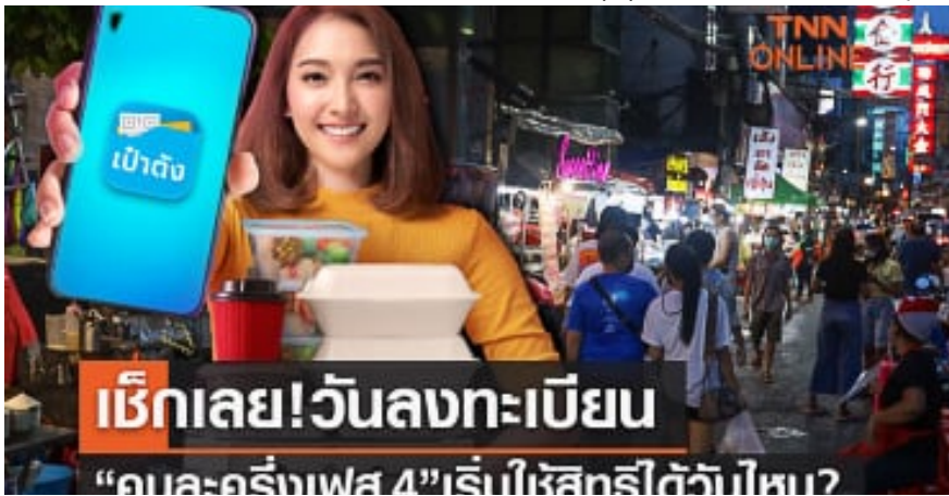
เช็กเลย! คนละครั้งเฟส 4 เริ่มลงทะเบียน-ใช้สิทธิ์ได้วันไหน?