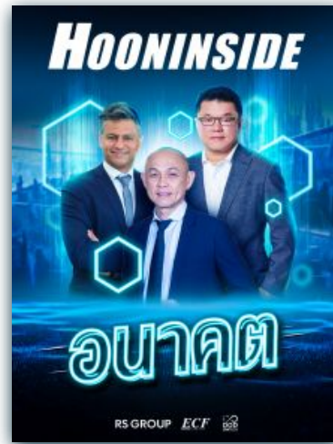
รายเดือน