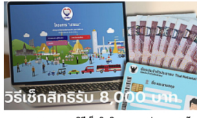
www.เราชนะ.com วิธีเข็กสิทธิเราชนะ กลุ่มทบทวนรับเงินงวดแรก 8,000 บาท Sanook