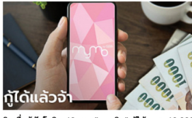
สินเชื่อน้องโควิด-19 จาก "ออมสิน" ทุ้ได้คนละ 10,000 บาท ผ่าน MyMo เริ่มวันนี้ Sanook