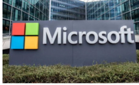
Microsoft พึ่งกำไรไตรมาส 4 ปี 2020 ที่ 4.5 แสนล้านบาทเพิ่มขึ้น 33% สูงสุดจากคลาวด์ Tech Update