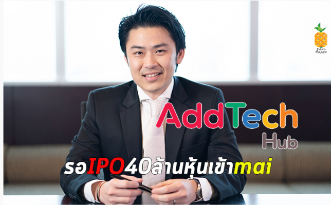
ก.ส.ศ. อนุมัติเงิน 1 หมื่น บมจ.แอดเทค ฮับ (ADD) จ่อ IPO 40 ล้านหุ้น... พัฒนาระบบสนับสนุนดิจิทัลแพลตฟอร์มออนไลน์